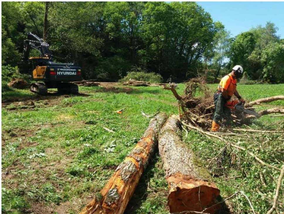
Restos vegetales extraídos del cauce