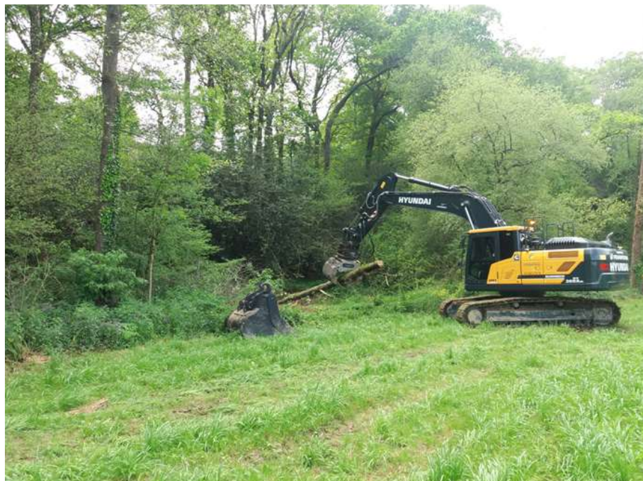
Extracción de restos vegetales de gran porte

Localización de la actuación, marcada en color rojo, en las proximidades de Hornedo