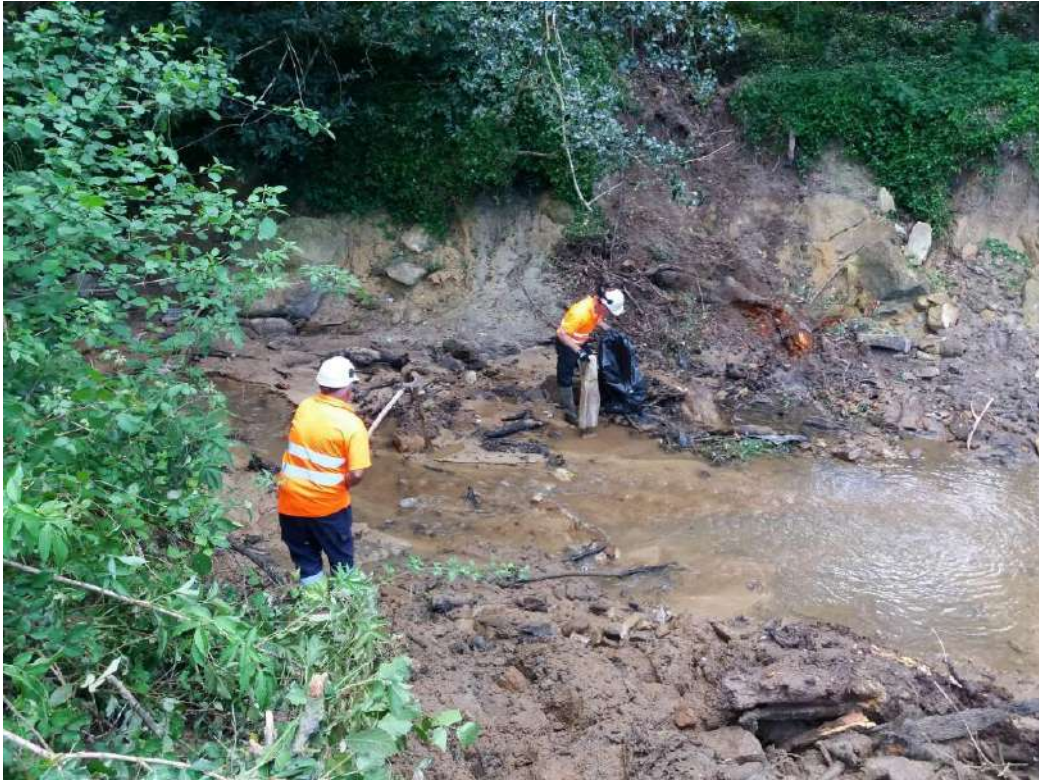
Extracción manual de restos en el cauce