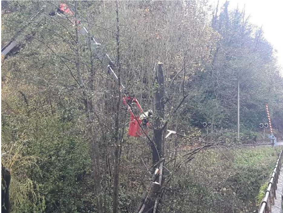
Trabajos con motosierra desde cesta elevadora