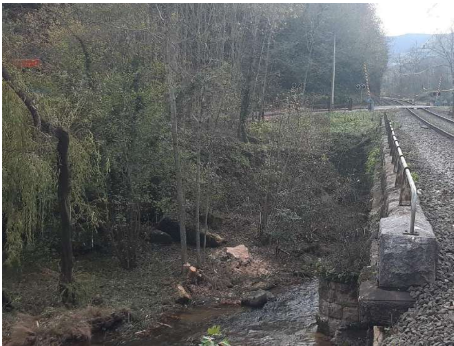
Estado después de la actuación