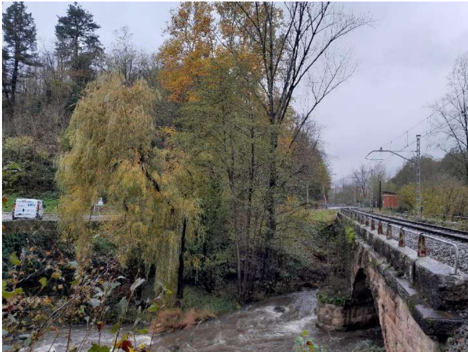
Estado previo a la actuación