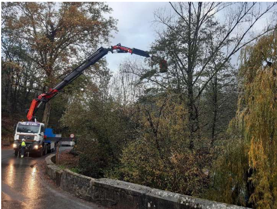
Trabajos de apeo del árbol desde cesta elevadora