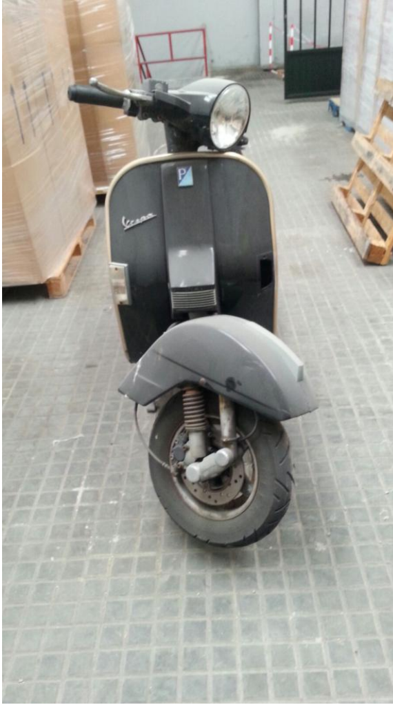
VEHÍCULO Nº: 5