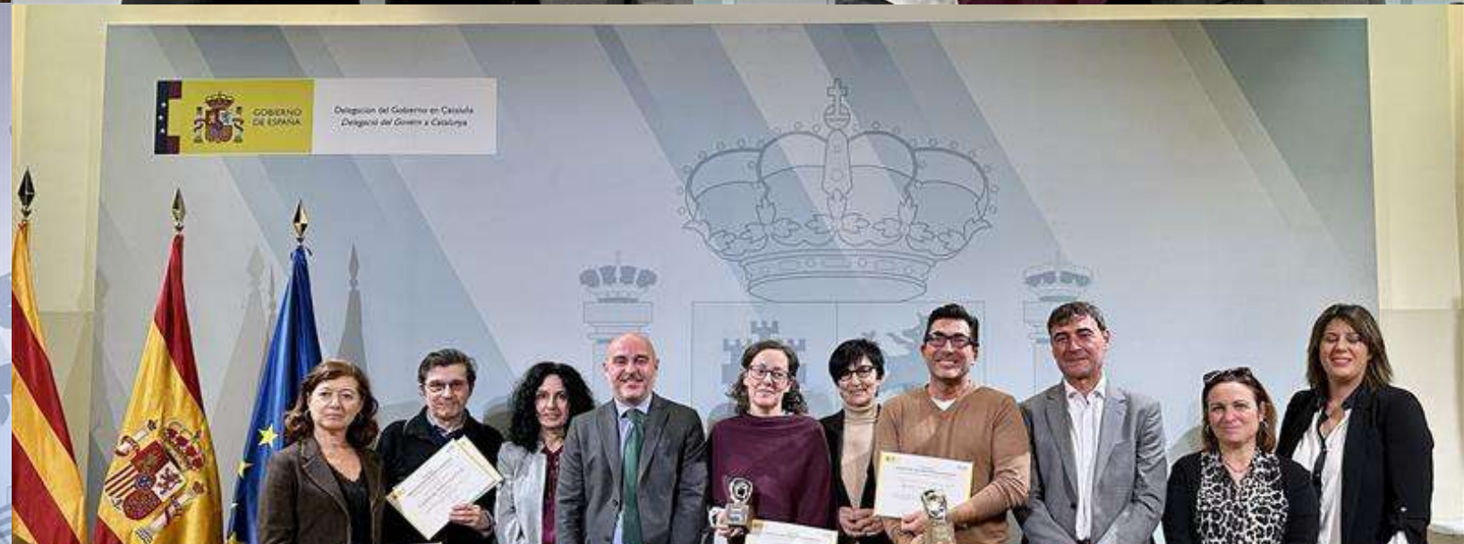
FOTOS ENTREGA PREMIOS RECONOCIMIENTO A LA INNOVACIÓN 19 DICIEMBRE 2023